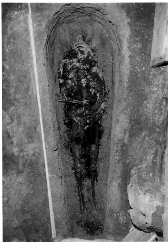
Grav IV innan benen togs upp

I koret flyttades Ragnvalds tumba undan. Den var massivt murad.(5) 30cm under golvet påträffades rester efter ett äldre golv.(4) Det äldre golvet verkar ha legat på träsyllar. På och under golvet fanns ett fyndförande lager. En ljusstake, målat glas och blyfalsar till glasfönster. Glasmålningarna daterades till slutet av 1200-talet I murverket längs väggarna fanns åtskilliga bitar av smält koppar.(5) Strax under det fyndförande lagret låg täckhällarna på två gravar (grav I och II) med flera gravlagda individer. Vid sidan av och delvis under låg en mindre barngrav (III). Under dessa gravar påträffades täckhällen till ytterligare en grav (IV). Hällen låg 90cm under det äldre golvlagrets nivå vilket ansågs anmärkningsvärt (vilket det ju också är). För att kunna lyfta täckhällen var man tvungen att plocka bort två av gravkistorna (II och III). Vilket gjordes på ett sådan sätt att de kunde muras upp igen. De tre översta gravarna var jordfyllda men inte den understa. I den understa graven fanns ett skelett in situ och åtskilliga klädesrester.(4) Tygrester finns även från grav II. Dessa är av en typ som vävdes i Spanien på 1200-talet.(Regner 2007)